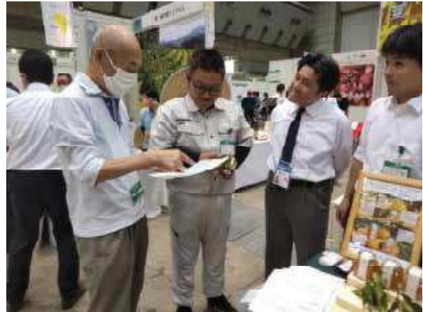
(相談対応等を行う専門家)