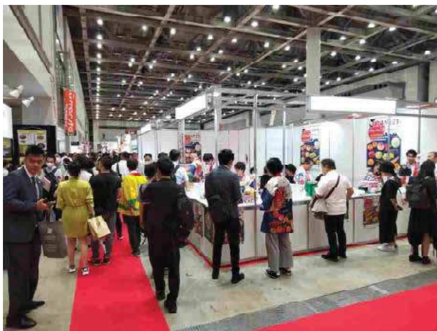
（輸出EXPOの会場の様子）

本輸出EXPOは6月21日～23日に東京ビッグサイトで開催され、相談者等には課題解決支援事業のリーフレット（課題解決支援事業事務局作成）及び諸外国に植物等を輸出する場合の検疫条件一覧（早見表）（植物防疫所ホームページ）