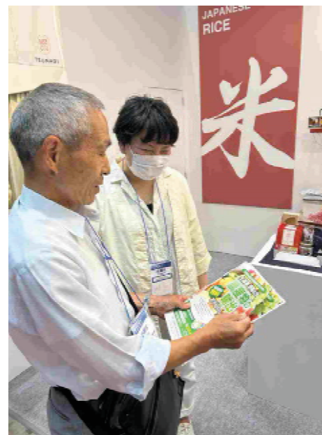
（相談対応等を行う専門家）