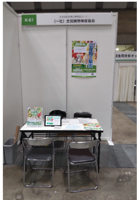
(アグリフードEXPO東京で設置したブース)

なお、主催者によると本イベントの出展者数 465 先、来場者数は 8,889 人とのことであった。