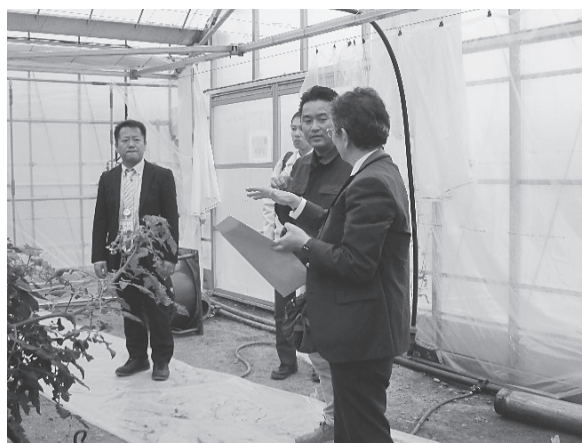
写真 トマト栽培施設内での説明の様子