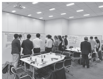
写真 GFP超会議(大阪)ワークショップの様子

サポート専門家の協力を得て、17事例を収集し事例集を作成。その構成は、専門家を派遣した経緯、産地の課題、輸出先国の規制等、専門家による技術的サポートの実施状況及び実施後の状況等と現地での写真を掲載した。