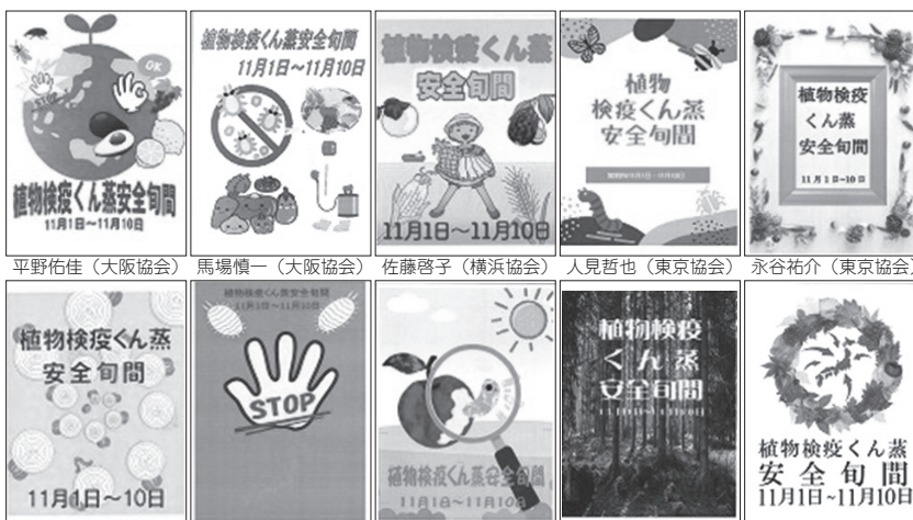
平野佑佳(大阪協会) 馬場慎一(大阪協会) 佐藤啓子(横浜協会) 人見哲也(東京協会) 永谷祐介(東京協会) 河野祐子(九州協会) 西谷光弘(関東港業) 山本利樹(関東港業) 中野和志(関東港業) 草野洋子(関東燻蒸)