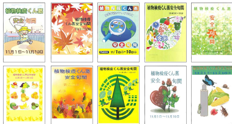
入選 (10 作品)