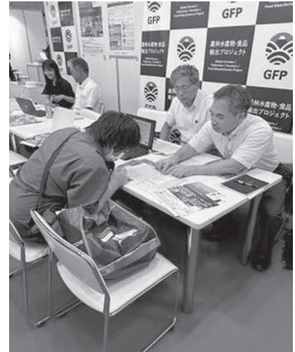
(イベントで相談対応する専門家)

また、専門家を派遣した24件の産地中、3件の産地はGFP事務局(地方GFPを含む)が主催するGFPオンライン訪問診断に専門家が参加したもので、輸出植物検疫の概要、輸出を希望する国の植物検疫条件、残留農薬の留意事項などについて説明した。