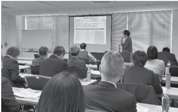
(植物検疫全国研修会の様子)

講演では、①海外及び国内の病害虫の被害例から植物防疫制度の必要性と目的の解説、②我が国の植物防疫の法制度と体制及び植物防疫所の組織などの解説、③輸入植物検疫の状況や広報活動の紹介、④輸出植物検疫の状況や登録検査機関の活用などの紹介、⑤ePhyto（電子植物検疫証明書）の導入、⑥植物検疫くん蒸をとりまく課題として農薬再評価制度への対応などについて説明がありました。